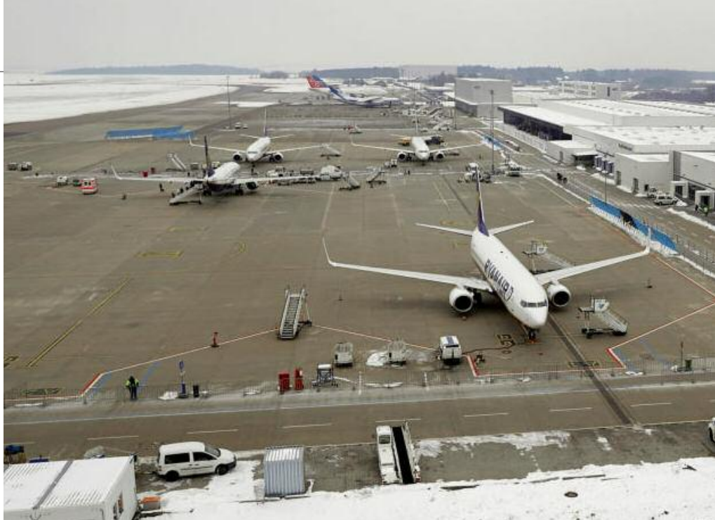
Defizitärer Flughafen Hahn, rheinland-pfälzische Ministerpräsidentin Dreyer: „Eines unserer“