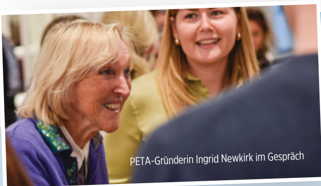
PETA-Gründerin Ingrid Newkirk im Gespräch