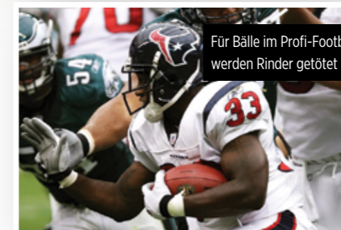
Für Bälle im Profi-Football werden Rinder getötet