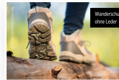
Wanderschuhe ohne Leder