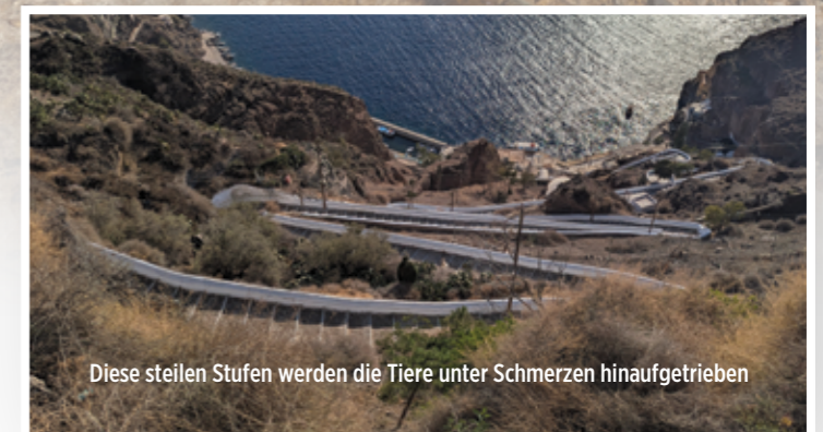
Diese steilen Stufen werden die Tiere unter Schmerzen hinaufgetrieben