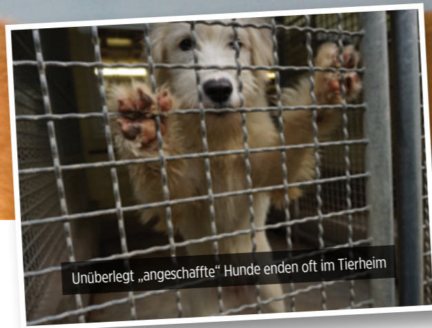
Unüberlegt „angeschaffte“ Hunde enden oft im Tierheim

Oft sind es die leisen Hinweise, die übersehen werden: ein Gähnen, ein abgewandter Blick, ein kurzes Schütteln oder ein „Bogenlaufen“. Hunde zeigen mit ihrer Körpersprache viel – auch dass sie unsicher sind oder Abstand wünschen. Doch viele Menschen nehmen diese Signale nicht wahr oder deuten sie falsch. Für die Tiere kann das bedeuten, dass sie sich unverstanden und alleingelassen fühlen und ihrem Menschen nicht vollständig vertrauen können. Im schlimmsten Fall können Situationen eskalieren und es kann zum Beispiel zu Beißvorfällen kommen. Trotzdem informieren sich viel zu wenig Hundehaltende darüber, wie ihre Tiere kommunizieren.