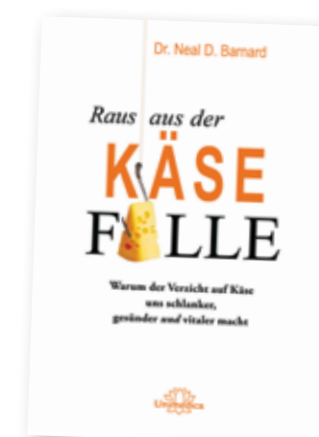
Cover-Abbildung: Haken © DenisNata - shutterstock.com Käse: © azure1 - shutterstock.com

Neal Barnard, Arzt und Autor des Buches Raus aus der Käsefalle , beantwortet Fragen rund um Ernährung und Gesundheit.